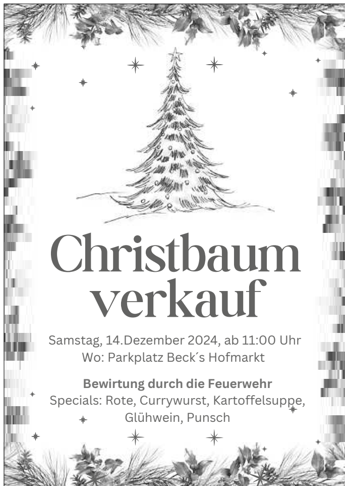
Plakat: Abt. Eberdingen

Am Montag, 02. Dezember 2024, trifft sich die Abt.-wehr um 19.30 Uhr zu einer Übung.